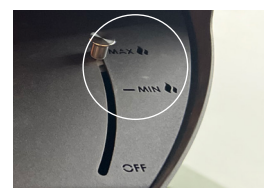
Régler/éteindre la flamme